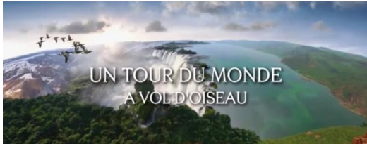
À vol d'oiseau

4) Enfin nous avons terminé les séances en parlant des expressions relatives au mot « oiseau » J'ai tenté de leur faire deviner les expressions par le biais de l'image. Puis nous avons cherché leur signification.