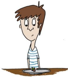
Avoir un appétit d'oiseau