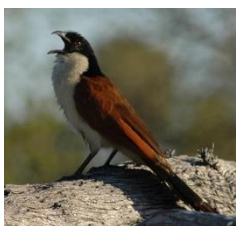
Un oiseau chante sur une branche. (Lola, Olivia F)

Par deux, les élèves produisent une phrase en utilisant le plus possible de mots de la fleur « oiseau ». Puis lecture collective afin de discuter des phrases produites.