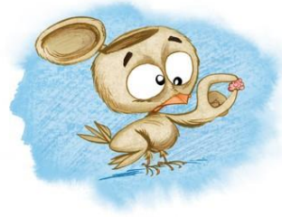
Avoir une cervelle de moineau