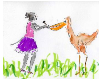
Clouer le bec à quelqu'un